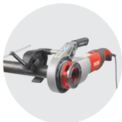
690-I Ruční závitřezný stroj Katalog. č. 44933

NAVŠTÍVTE RIDGID.EU PRO DALŠÍ ŘEŠENÍ PŘI ŘEZÁNÍ A DĚLENÍ POTRUBÍ