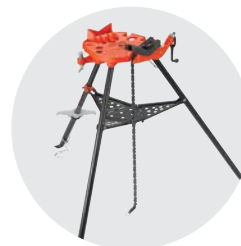
460-12 Přenosný řetězový svěrák TRISTAND Katalog. č. 36278