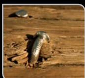
Dřevo s hřebíky