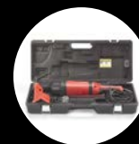
Přesný, lisovaný transportní kufřík