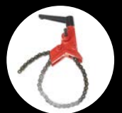
6" řetězový svěrák pro silné zatížení