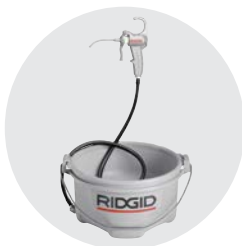
418 Maznice Katalog. č. 73442