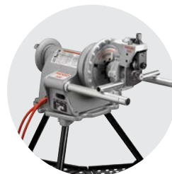
975 Kombinovaná drážkovačka Katalog. č. 33033